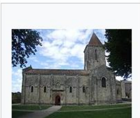
Eenbeukige zaalkerk: Saint-Pierre de Melle

De romaanse stijl kreeg dus zijn naam omwille van de gelijkenis met de Romeinse bouwstijl, die door de vaklui van die tijd bekend was van de talloze Romeinse monumenten, zeker in het huidige Italië, Zuid-Frankrijk en Spanje. Anderzijds is de term misleidend, omdat de romaanse stijl evengoed schatplichtig is aan de Karolingische en de Ottoonse, maar evengoed aan de Romeinse en de Byzantijnse bouwstijl. In Engeland wordt de romaanse bouwstijl meestal de Normandische stijl genoemd.