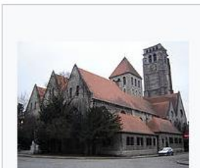
Driebeukige hallenkerk: Saint- Brice in Doornik