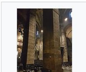
Interieur driebeukig schip: Onze- Lieve-Vrouwebasiliek, Maastricht