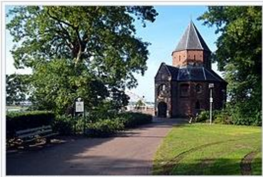
Sint-Nicolaaskapel, Valkhof park Nijmegen

Daarnaast diende een aantal kerken het aanzien van een wereldlijke macht te weerspiegelen, waarvan de Valkhofkapel in Nijmegen en de Sint-Servaaskerk te Maastricht (Duitse keizers) en de Munsterkerk in Roermond (Gelderse hertogen) getuigen.