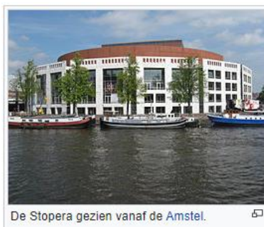
De Stopera gezien vanaf de Amstel.