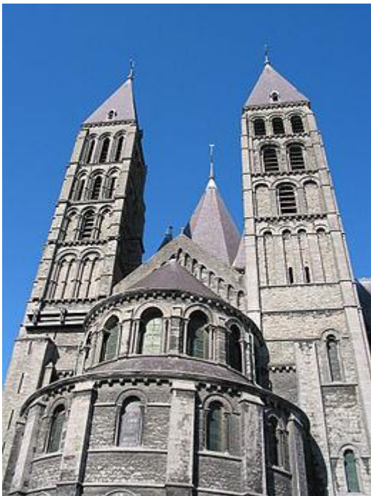
Romaanse koorpartij van de Onze-Lieve-Vrouwekathedraal in Doornik

We vullen dit graag aan met meer informatie en afbeeldingen.